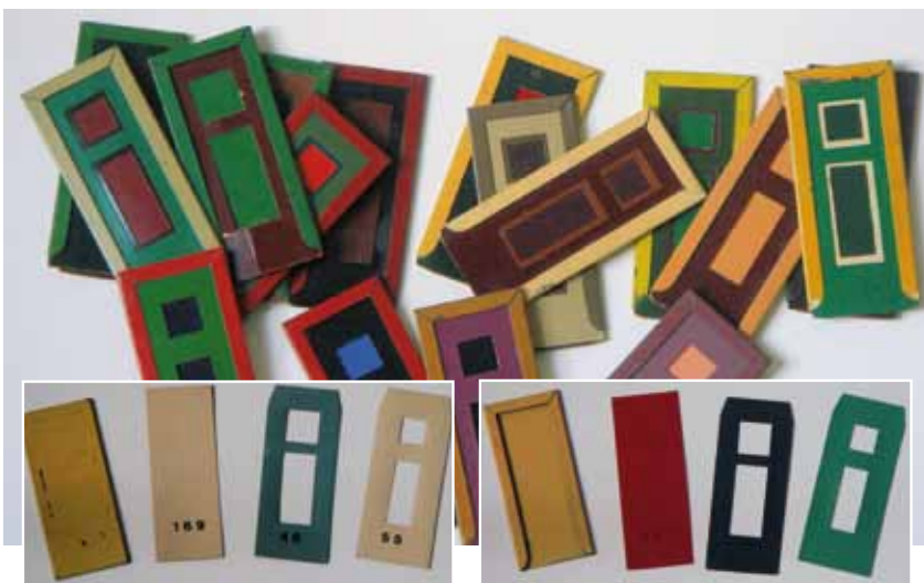
▲ Een ingenieus systeem maakt het mogelijk verschillende kleuren van de deur, kozijn, paneel en schaaflafzetting te combineren.

VAROSSIEAU & Cie. N.V. OPGERICHT 1795 ALPHEN a/d RIJN TELEFOON 50