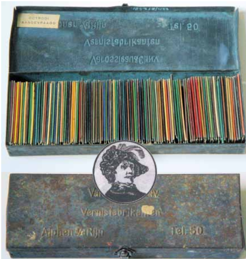
▲ De stalen doos van vernisfabriek Varosseau met meer dan 190 miljoen combinaties aan kleurmogelijkheden.