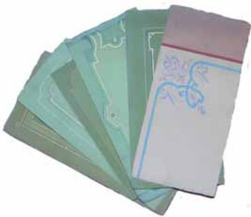
▲ Sommige schilders maakten ook beschilderingen op maat, om opdrachtgevers te tonen hoe het er in werkelijkheid uit zou gaan zien.