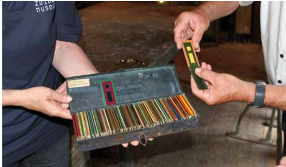
▲ Demonstratie van de 'kleurencombinator' van Varossieau.

Eind negentiende eeuw was het niet gemakkelijk om aan de opdrachtgever een visueel kleuradvies te geven. Het Schildersmuseum in Enkhuizen bezit een aantal objecten waarmee schilders en fabrikanten in de periode 1870 tot circa 1930 inzicht gaven in de mogelijkheden op kleurgebied. Een stukje cultureel erfgoed.