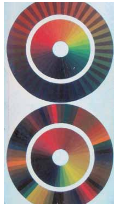
▲ Een bedreven meesterschilder stelde zijn eigen kleurschema's samen. Achterop ieder genummerd vel werd de samenstelling van kleuren vermeld.